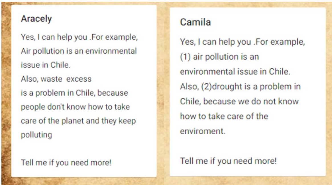
Figura 2. Padlet modificado y completado por los estudiantes, sesión 2.