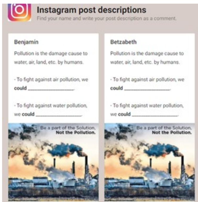
Figura 1. Plantilla de escritura plataforma Padlet sesión 1

Otro elemento importante que se identificó en el uso de Padlet, es que los estudiantes lograron conectar sus ideas con las de sus compañeros, situación que fue comentada en las actividades de cierre donde los asistentes indicaron que les gustaba leer y entender las opiniones de sus compañeros en inglés y qué estos también pudieran leerlos a ellos.